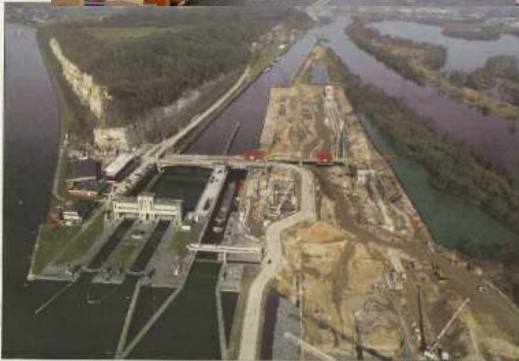
Berevo- en polderwater gaan door de sluizen van Ternaaien (links). De afsluipende tak van de Maas (rechts) is razet bewerkt. - schied van Jeroen Duijzer