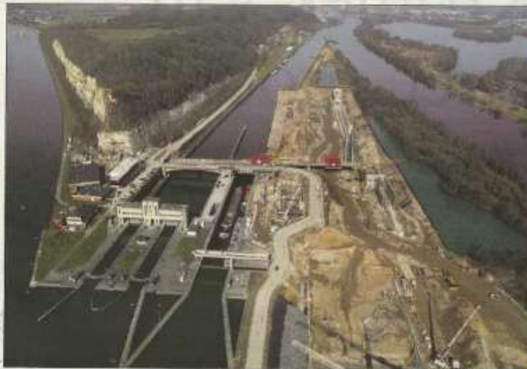
Beveer- en pleetvaart gaan door de sluizen van Teraslan (links). De afzinkende tak van de Maas (rechts) is niet bevaarbaar.

Voorlopig wordt de aanpak van de oeverzijde van de Maas tussen Maastricht en Eijsden een nieuw watersportgebied worden.